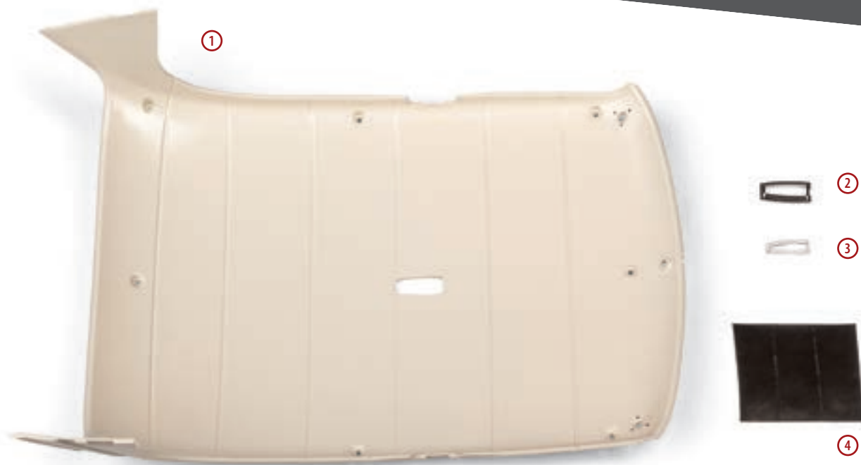
1 — обивка потолка; 2 — ободок плафона; 3 — рассеиватель плафона; 4 — клейкая лента